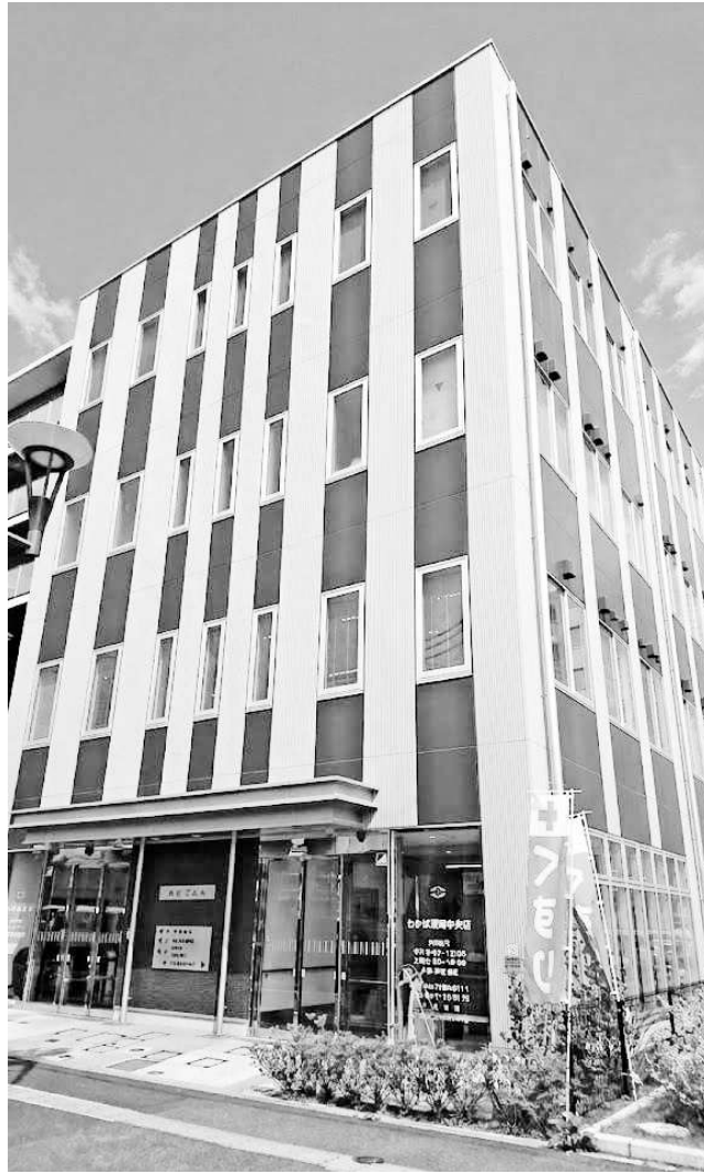
駅前診療所の外観

院前カンファレンスの実施もより円滑になり、病院から在宅へ、切れ目のない安心をお届けできることは、患者様・ご家族様、そして我々医療従事者にとっても極めて大きなメリットであると確信しております。